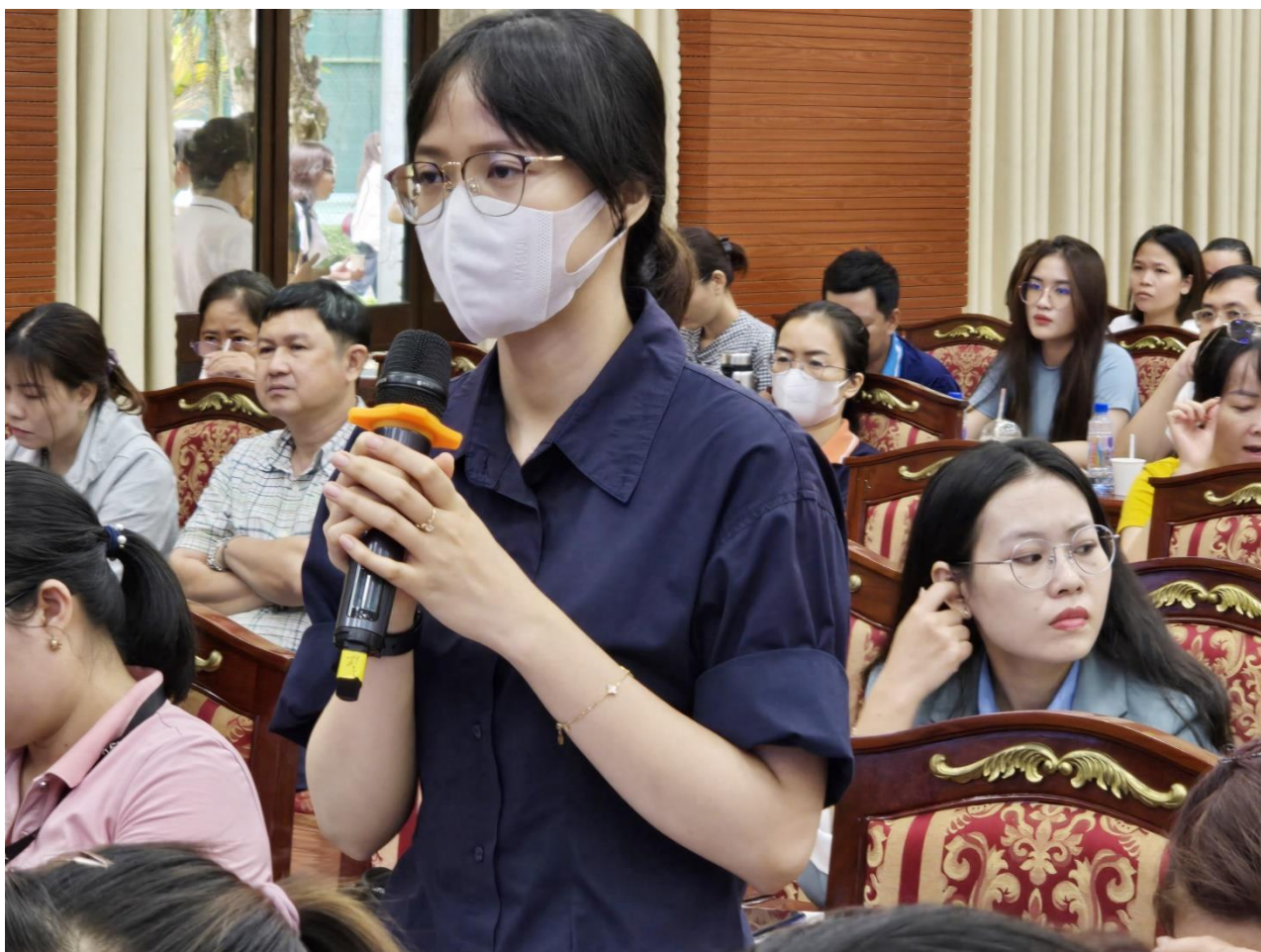
Người lao động nêu ý kiến tại buổi tọa đàm